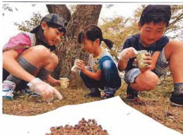
サクランボを拾い集める子どもたち(14日午前、奈良県吉野町で)

ビーバンジョアは今年で活動を始めて9年目に入ります。これからも世界遺産吉野を桜を守る活動を応援します。